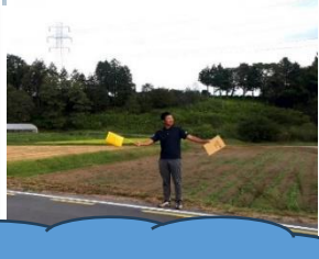
活動のイメージ画像です